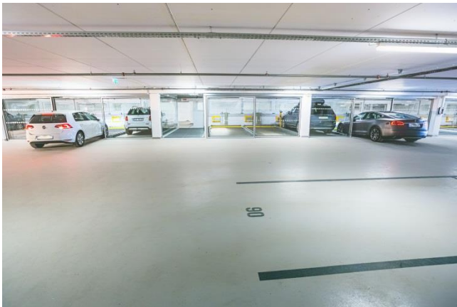
Bild: Combilift 542 Parksysteem Die WÖHR Smart Parking App wird zukünftig auch für automatische Parksysteemlösungen verfügbar sein.

Bild: Die Smartphone-App von WÖHR ist freundlich im Design und einfach in der Bedienung. Es wird automatisch auf Tag- und Nachtmodus gestellt, je nach Helligkeit der Umgebung. Fahrer können auf dem Display ihres Mobiltelefons sofort den Status ihrer Anforderung überprüfen. Sollte das Parksysteem im Wartungsmodus sein, wird dies auf dem Display ebenfalls angezeigt.