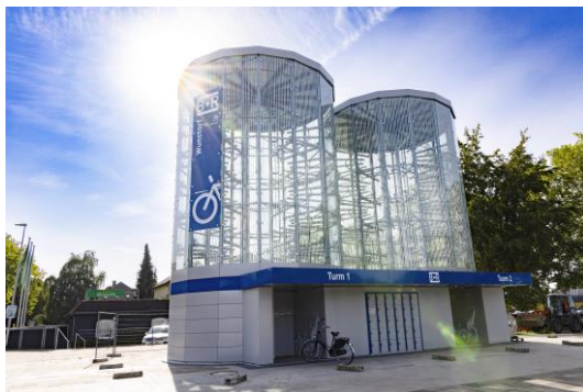
Bild 1: Bikesafe-Zwillingstürme am Bahnhof Hannover-Wunstorf