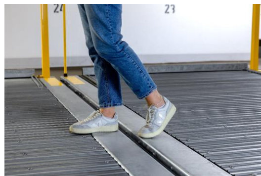
Imagen 2: Plataforma plana, accesible y sin barreras