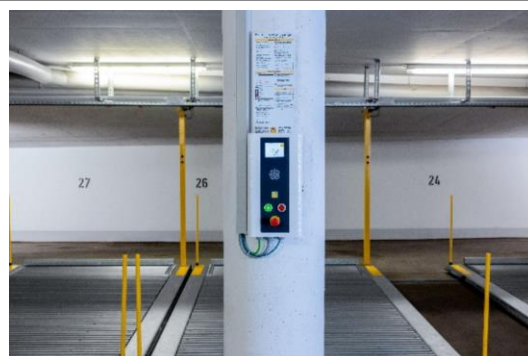
Imagen 4: Panel de control moderno con visión directa de las plataformas